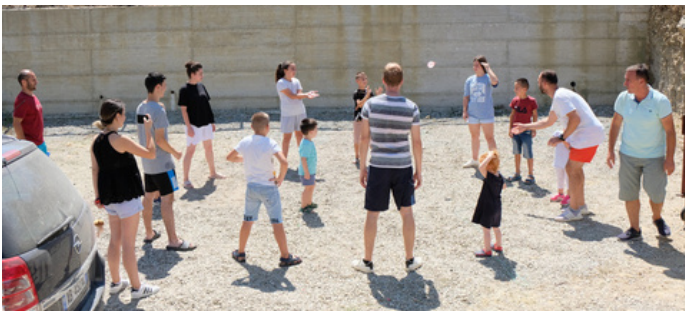
Bijbelspelweek in Pinet

Los van onze gebruikelijke wekelijkse activiteiten, zijn we in de zomermaanden aan de slag gegaan met enkele mooie projecten. Zo hebben we de kerkzaal van onze kerk opgeknapt. Deze ruimte had dringend behoefte aan een goede verfbeurt. Verder gaan we regelmatig naar het dorpje Pinet om relaties warm te houden en programma's te organiseren voor de jeugd. Sinds 2010 komen we in Pinet voor evangelisatiewerk en het is belangrijk om deze relaties te blijven onderhouden. Eind juli verzorgden we in samenwerking met een kerk uit Roemenië een complete bijbelspelweek.