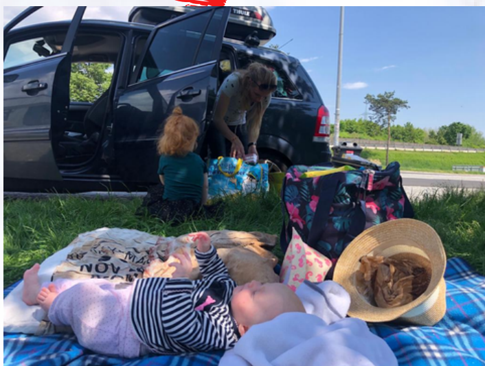
picknicken onderweg naar Albanië