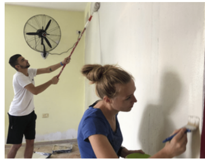
Verfbeurt in onze kerk