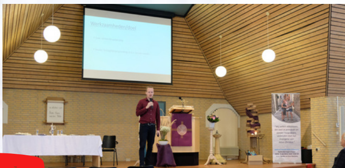
Spreekbeurt in een kerk